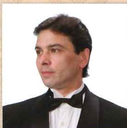
芸術監督 イルギス・ガリムーリン