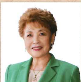
総監督 牧 阿佐美